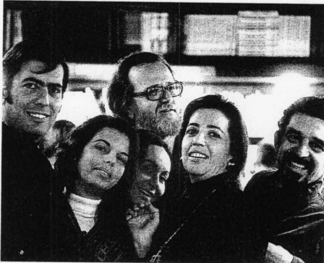
En Barcelona. Colita retrató a Vargas Llosa, Donoso, García Mazquez y esposas en 1972