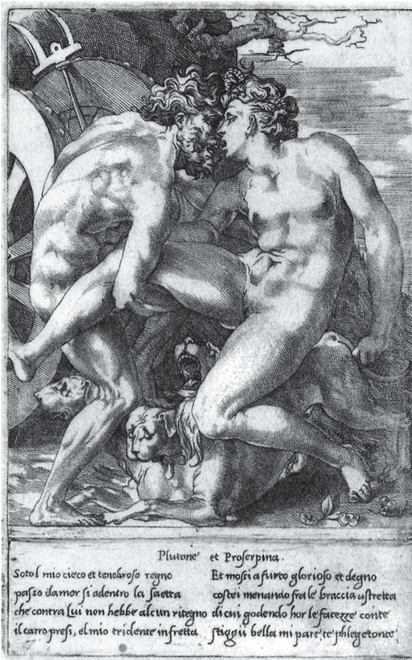
Plutón y Proserpina, hacia 1527

olviden sus lectores. (Tampoco los políticos intercalan ya citas en sus discursos, como solían los más cultos de antaño.) En cambio, el texto de los Ensayos está plagado o alfombrado de esas citas. No por mero afán de