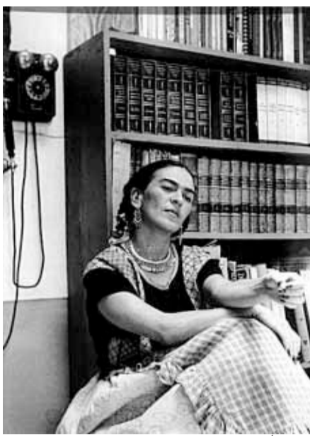
Frida Kahlo, en una foto de la muestra

Es una gigantesca exposición con 354 pinturas, óleos, dibujos, acuarelas y grabados, 50 cartas y 100 fotografías que recuerdan a Frida Kahlo. “Mostramos las múltiples caras de Frida; damos a conocer a la Frida total, la Frida completa, la Frida integral, los aspectos de Frida que no han visto. Además de la pintora y de la mujer operada, damos a conocer a una mujer de una gran inteligencia, con unos documentos y cartas donde se ve que hay una verdadera sinapsis, o sea, utilización de neuronas”, dijo