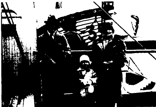
El escritor Francis Scott Fitzgerald con su mujer Zelda y su hija Scottie en diciembre de 1926

Llega hoy, más de medio siglo después de haber aparecido en Estados Unidos -la edición original es de 1960-, El desencantado produce un efecto contradictorio. Tiene el mérito de haber sobrevivido hasta ser considerado un pequeño clásico de la literatura norteamericana. ¿Quién es su autor, Budd Schulberg, nacido en Nueva York en 1914? Los cinéfilos lo saben perfectamente. Hijo de un directivo de la Paramount, es un producto del viejo Hollywood cuyas virtudes y miserias encarna. Guionista de tres películas legendarias como La ley del silencio , Más dura será la caída y Un rostro en la multitud , rodadas entre 1964 y 1967, su actitud ante el comité de la vergüenza presidido por el senador McCarthy no fue precisamente ejemplar. Schulberg conoció a Francis Scott Fitzgerald a fina-