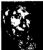
Budd Schulberg El desencantado Traducción de J. Martín Lloret